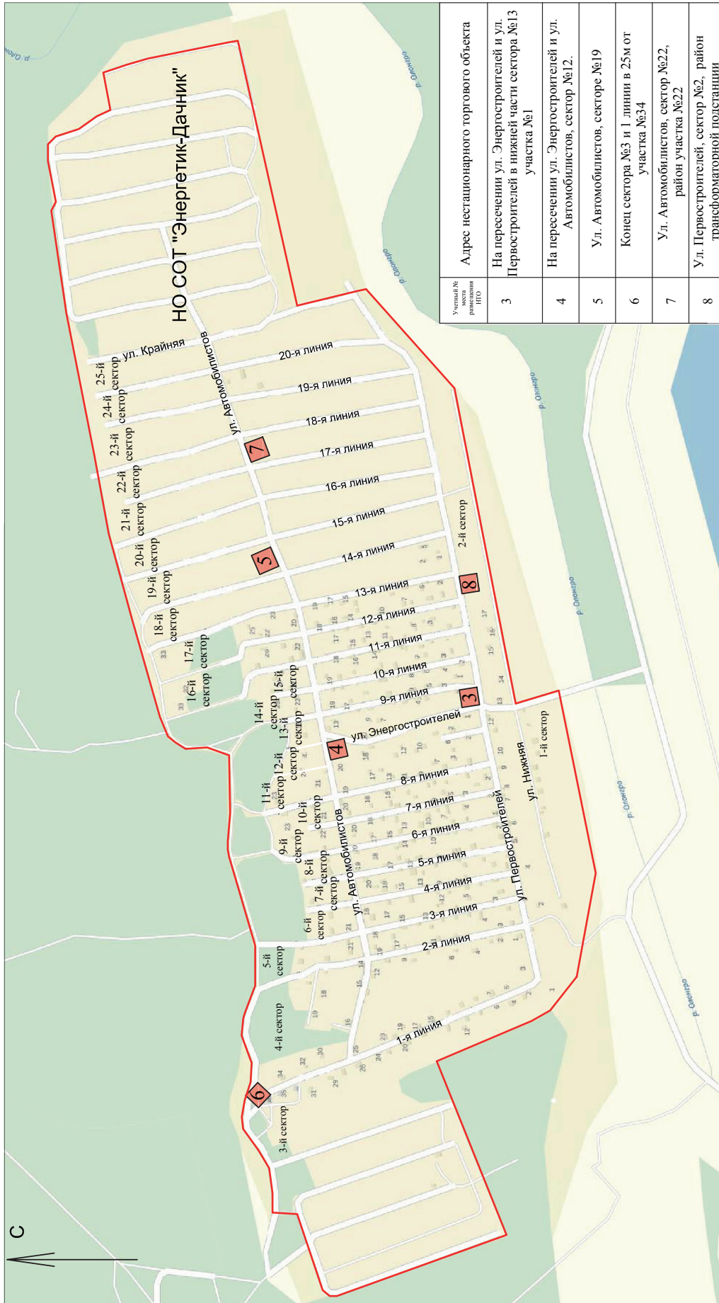
СХЕМА размещения нестационарных торговых объектов, расположенных на межселенных территориях муниципального образования "Нерюнгринский район"

Утверждена постановлением Нерюнгринской районной администрации № 748 от "26" 04 2017г. (приложение №2)