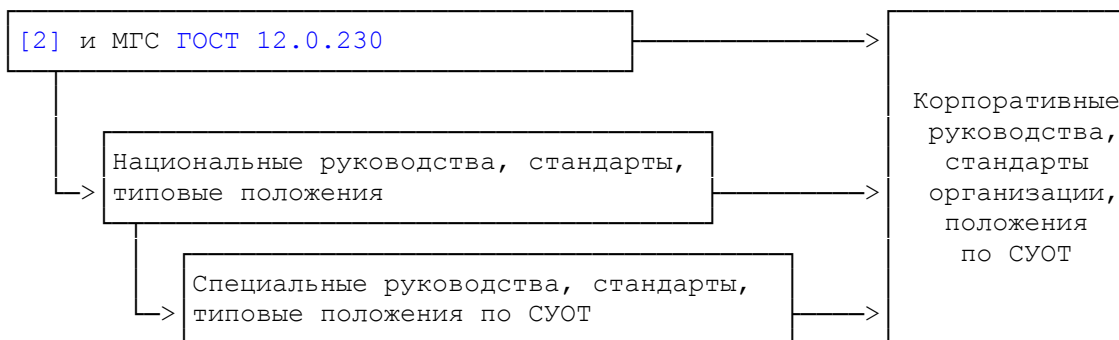
Рисунок 2 - Взаимодействие руководств/стандартов/положений по системам управления охраной труда

Взаимодействие нормативных документов по СУОТ может быть охарактеризовано структурой, приведенной на рисунке 2.